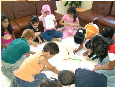
Activités psychosociales pour les enfants