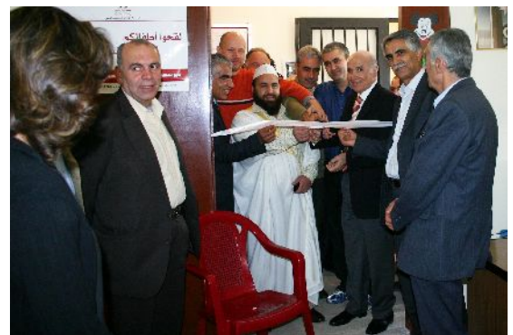
Réouverture du centre en Avril 2008